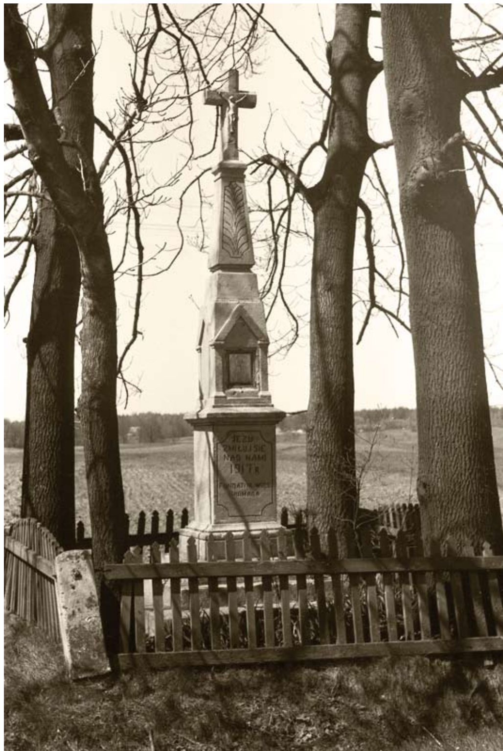
140. Biłgoraj – Gromada. Kamienny obelisk z 1917 roku (1980)