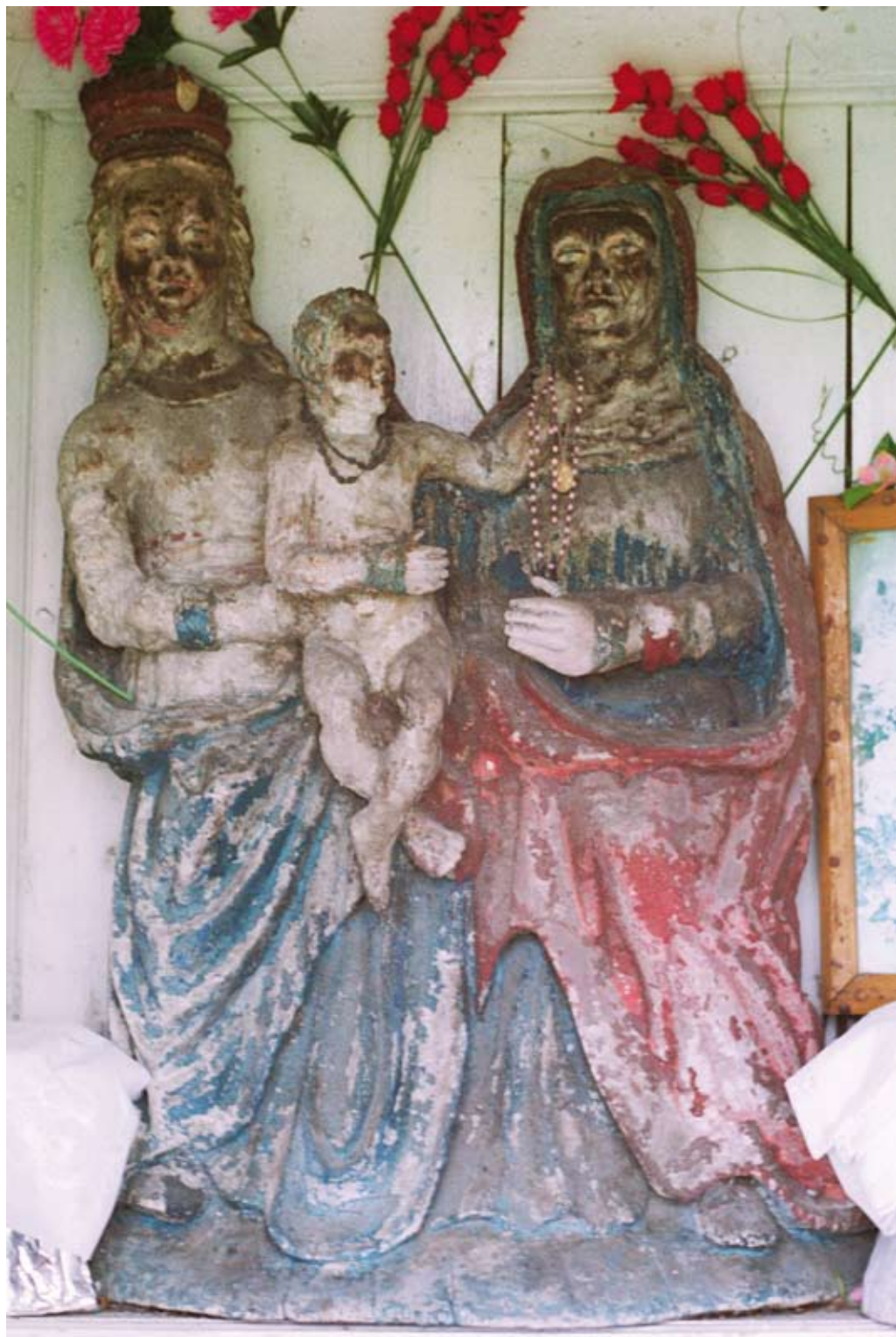
258. Biłgoraj – okolice. Rzeźba Pawła Bienia z drugiej połowy XIX wieku, przedstawiająca Matkę Boską z Dzieciątkiem i Annę Samotrzec, polichromowana przez Mikołaja Gumiełę (2006)