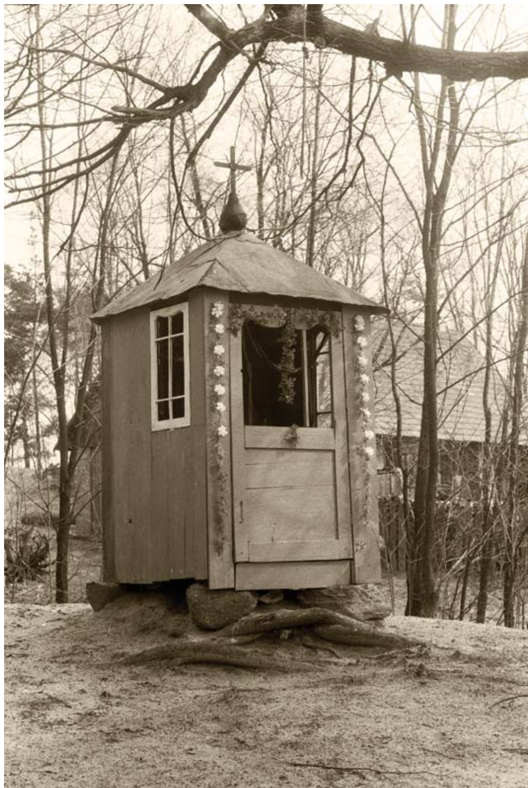
53. Majdan Stary. Ustawiona na głazach kapliczka domkowa (1980)