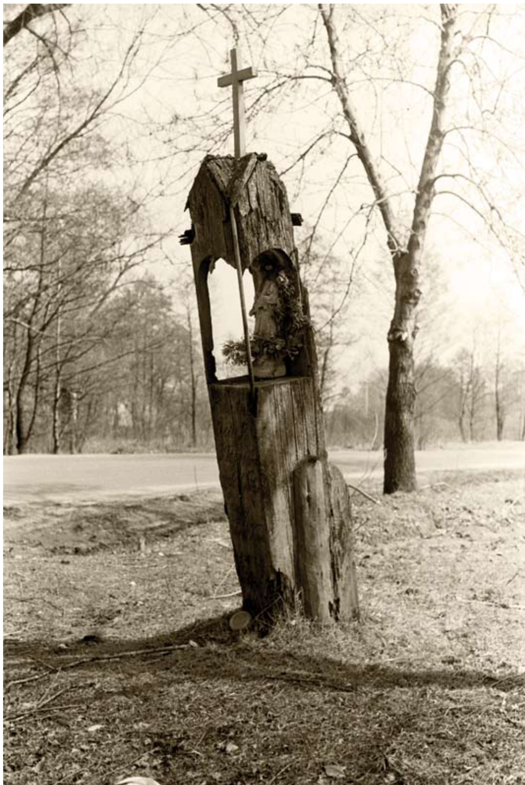
20. Biłgoraj – Sól. Kapliczka kłodowa, datowana na XIX wiek (1980)