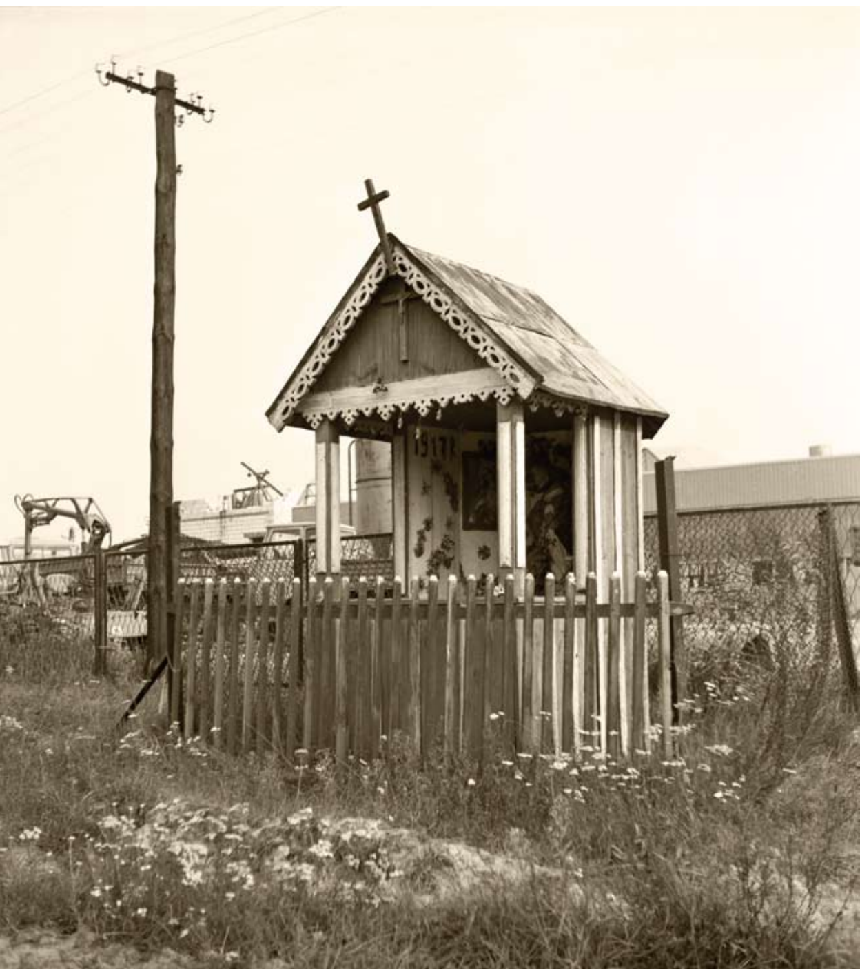
12. Biłgoraj (Puszcza Solska). Kapliczka domkowa z figurą św. Jana Nepomucena (1980)