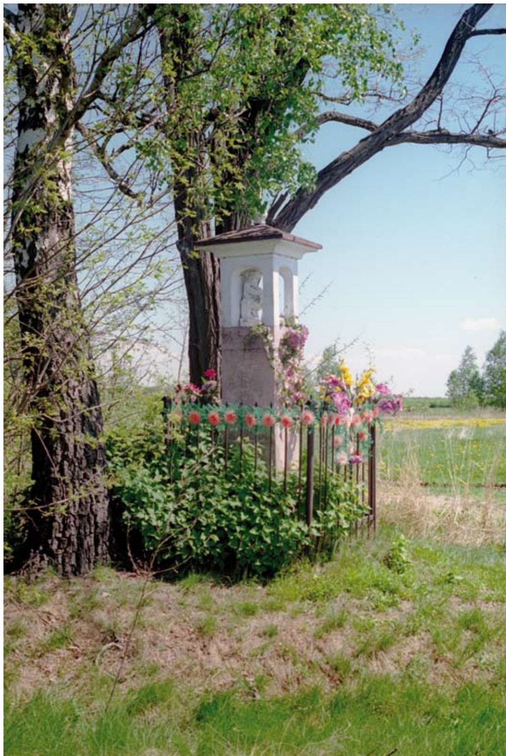
104. Dąbrowica – okolica. Kapliczka wnąkowa z Chrystusem Frasobliwym (2006)