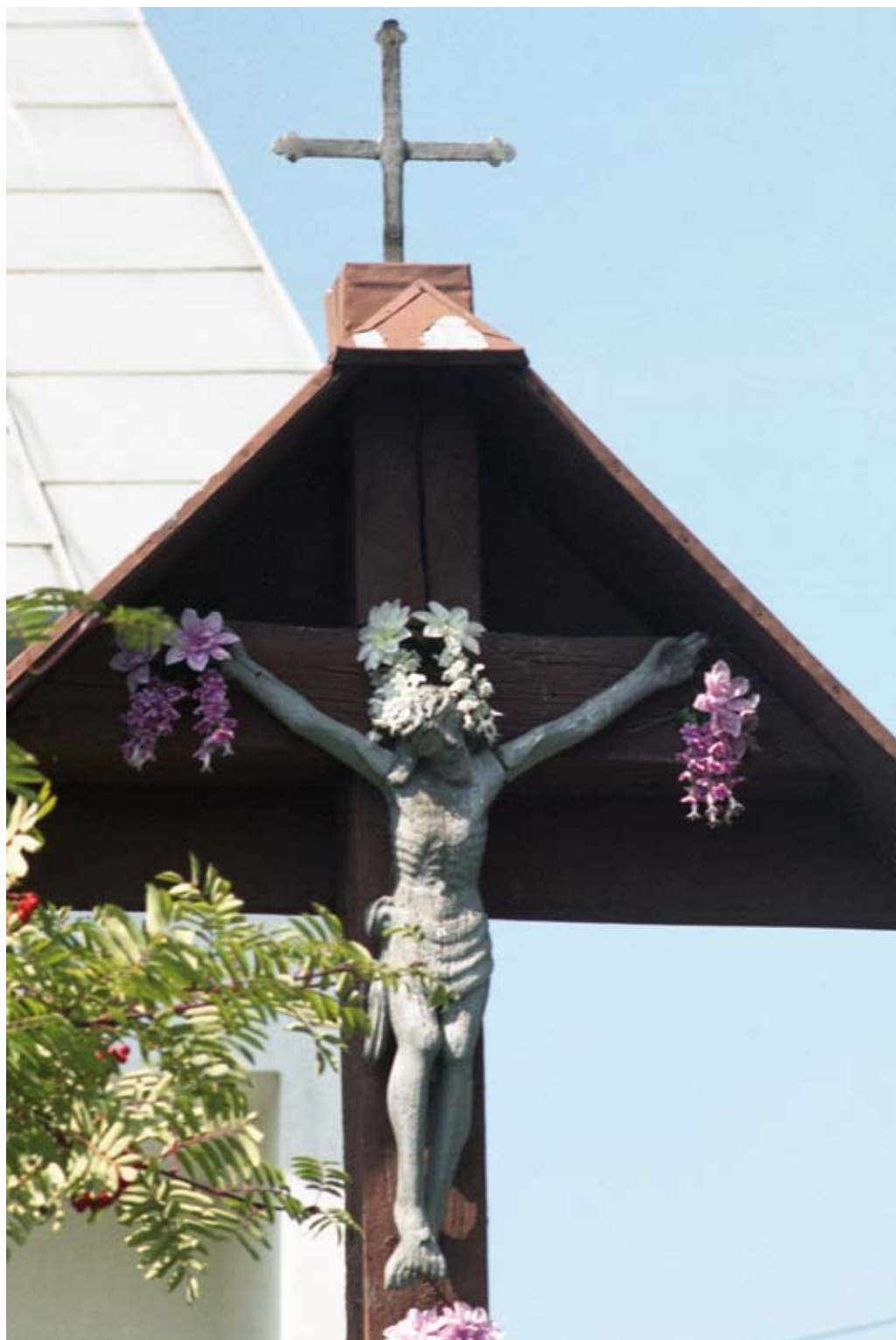
28. Sól. Rzeźba Chrystusa na krzyżu z 1907 roku (2004)