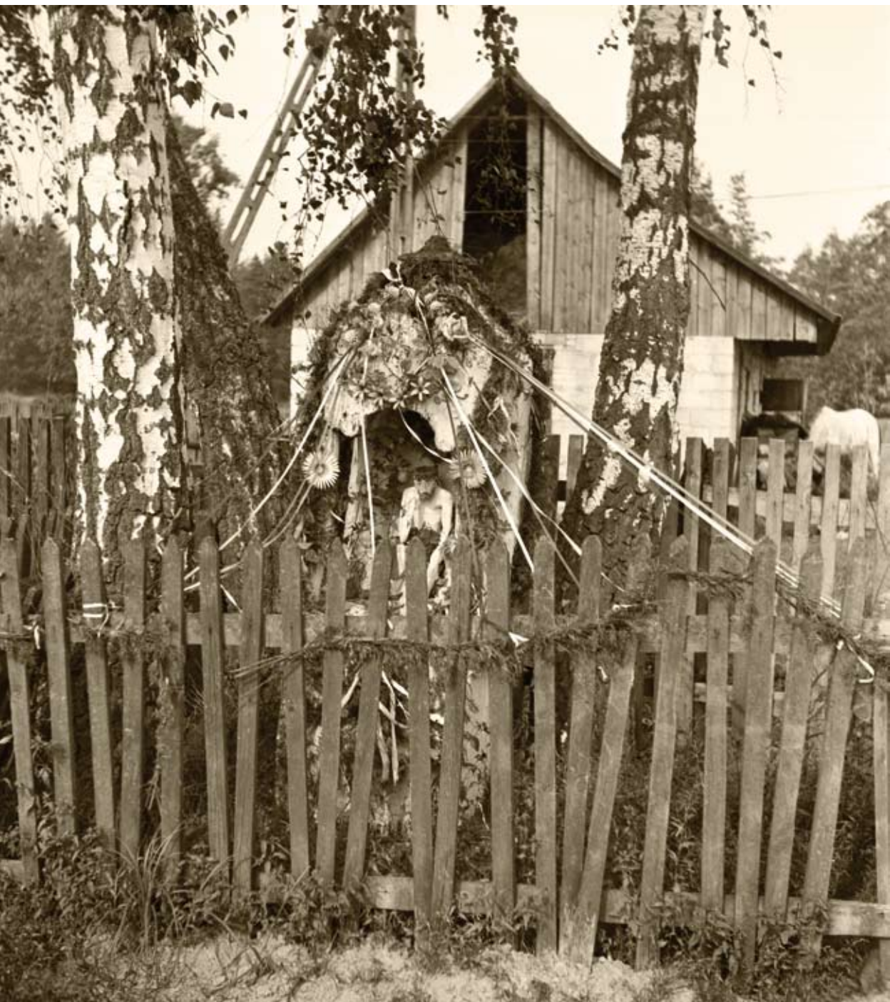
60-61. Stary Lipowiec. Kapliczka kłodowa z początku XX wieku i jej mieszkaniec – Frasośliwy (1980)