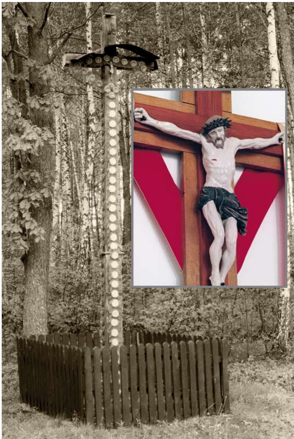
85. Jachosze. Prosty krzyż z 1906 roku, z rzeźbą Jezusa, obecnie w kościele w Starym Bidaczowie (2006)