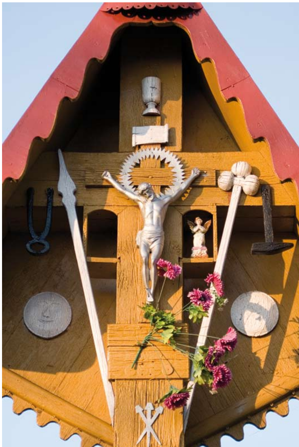
220. Kocudza. Symbole Męki Pańskiej, umieszczone na krzyżu z 1919 roku (2008)