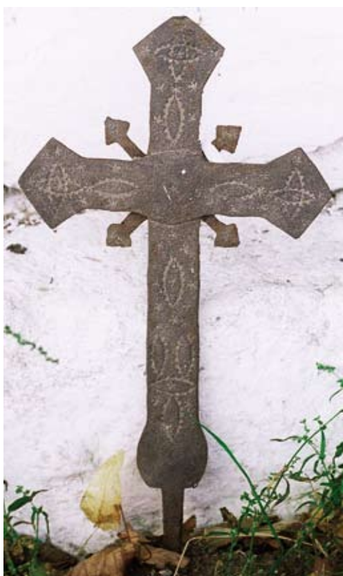
65. Aleksandrów. Ozdobny żelazny krzyż, stojący pierwotnie na kapliczce (2006)