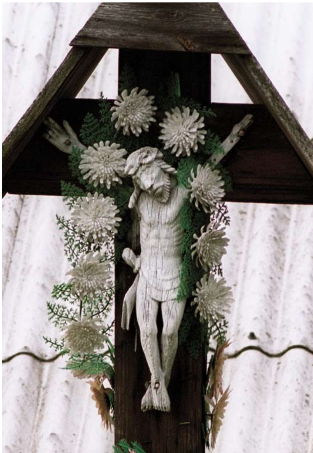
183. Bukowa. Rzeźba Chrystusa na krzyżu nr III (2006)