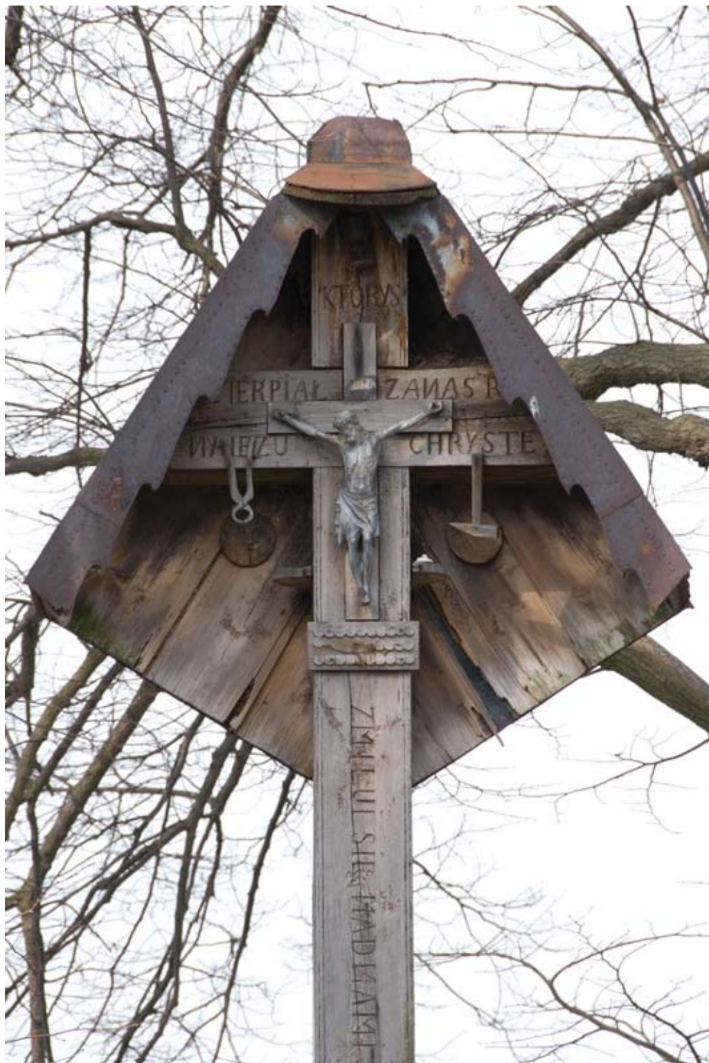
138-139. Biłgoraj – Gromada. Krzyż z 1906 roku, wzbogacony symbolami Męki Pańskiej (2008 i 2011)