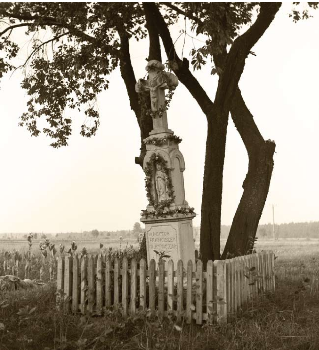
58. Rogale. Kamienna kapliczka z 1908 roku (1980)