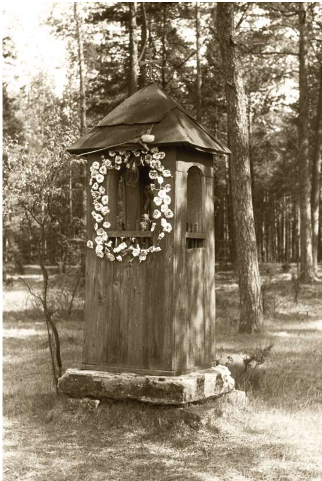
234. Frampol – okolice. Kapliczka kłodowa z XIX wieku (1980)