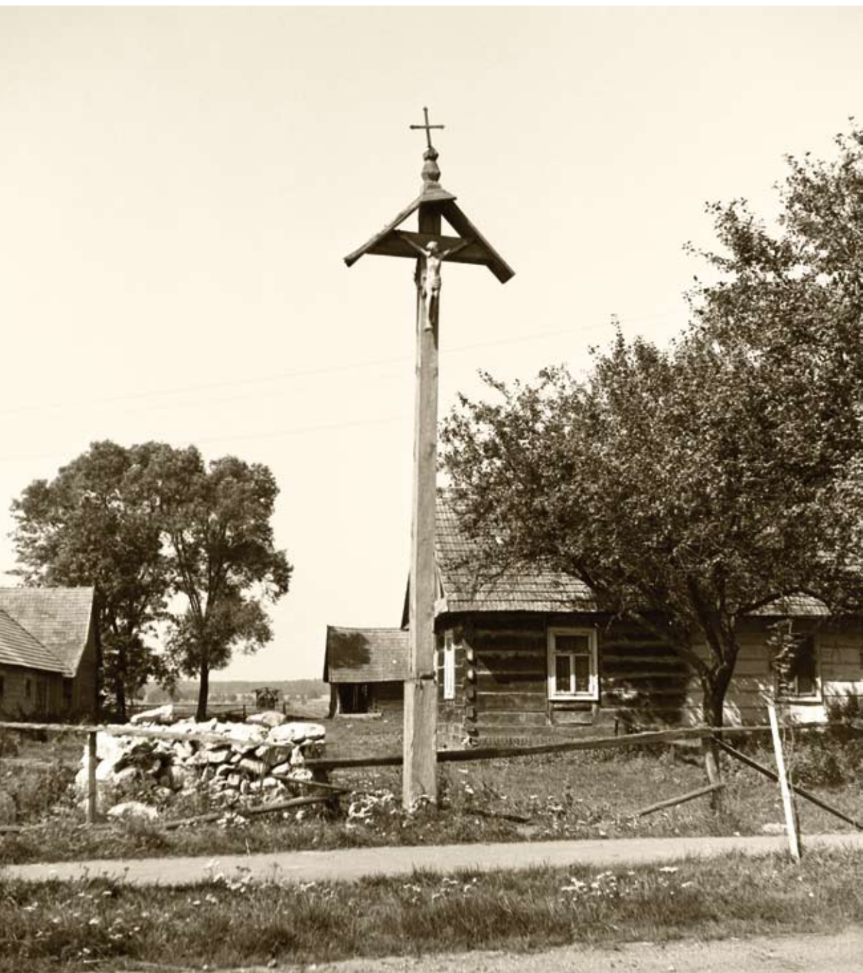
27. Sól. Krzyż z 1907 roku, z daszkiem osłaniającym rzeźbę Chrystusa (1980)