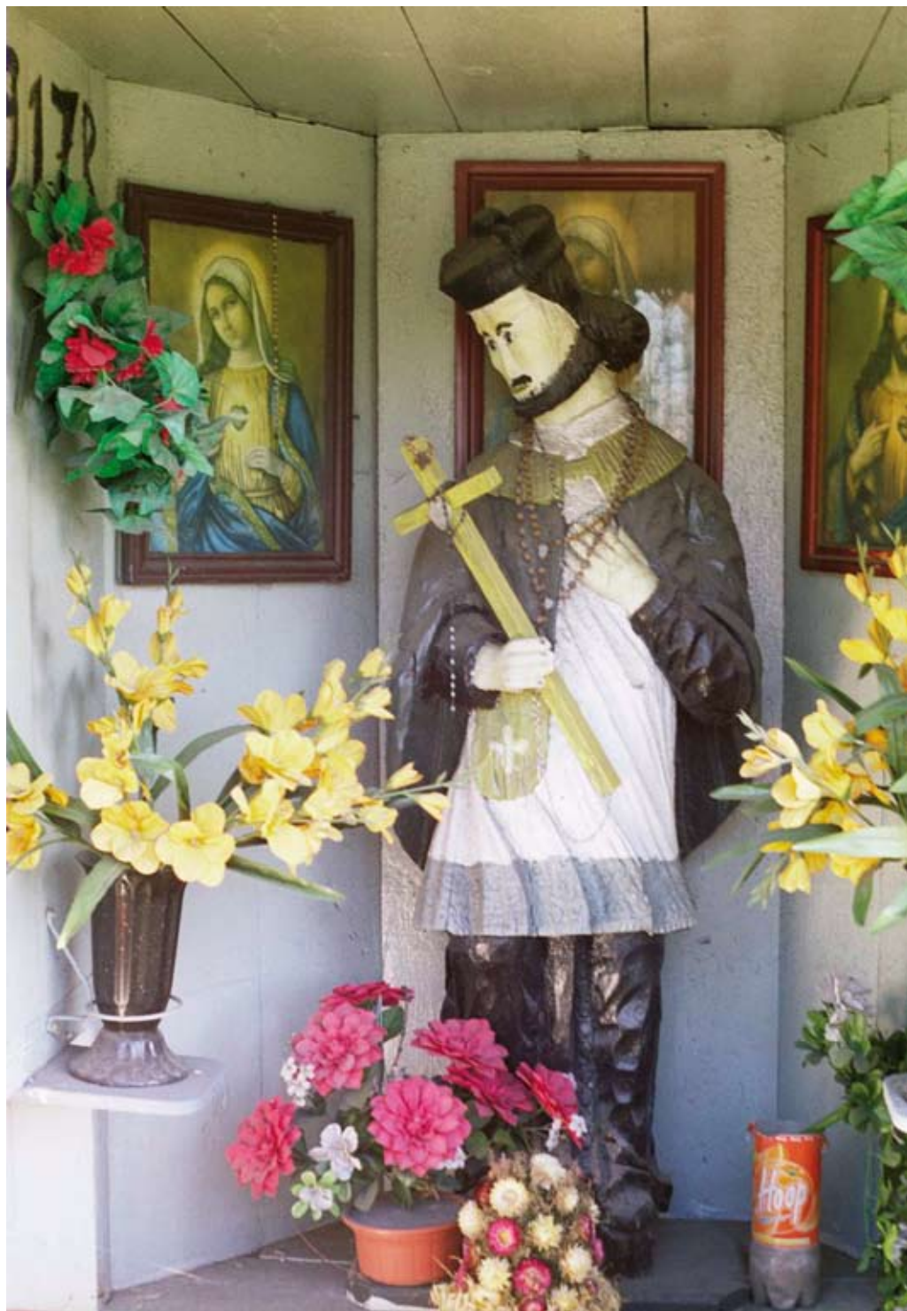
13. Biłgoraj (Puszcza Solska). Rzeźba św. Jana Nepomucena w kapliczce domkowej (2004)