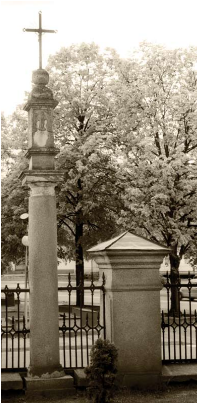
1. Biłgoraj, ul. 3 Maja. Kamienna kapliczka z 1699 roku (2006)