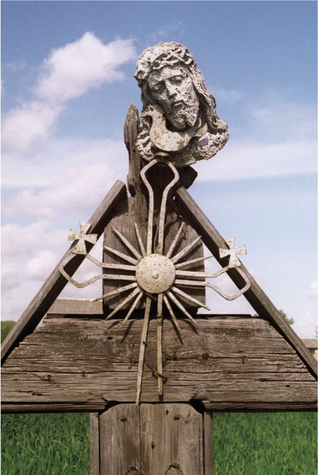
215-216. Kocudza. Krzyż i jego elementy (2006 i 2008)