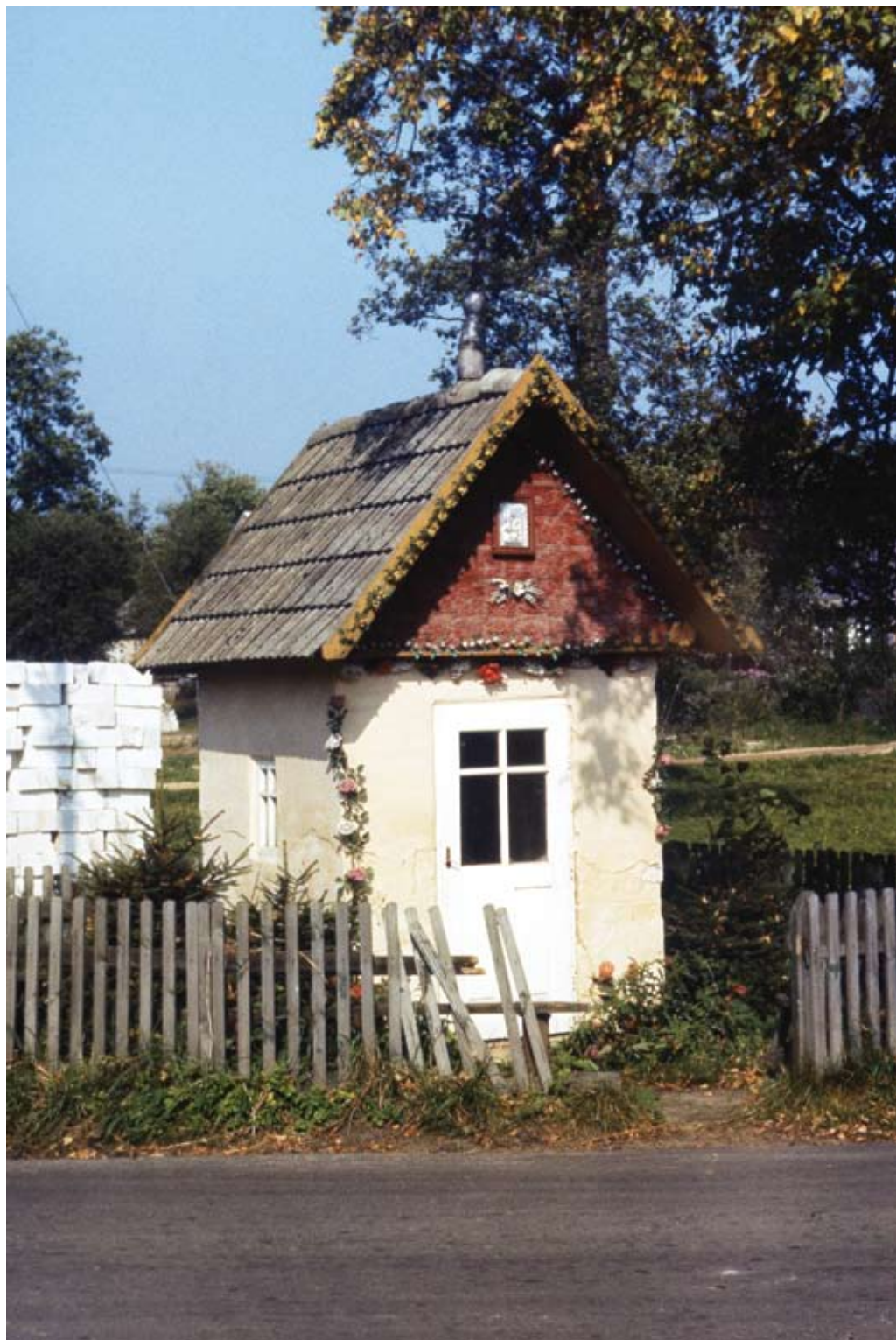
102. Dąbrowica. Murowana kapliczka domkowa przed rozbiórką (po 1980)