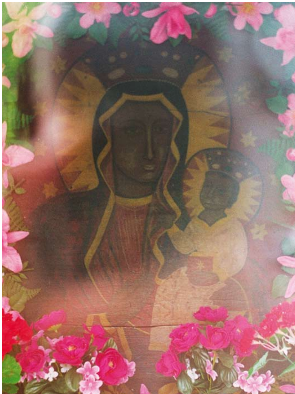
90. Banachy – okolica. Obraz Matki Boskiej Częstochowskiej ze starej kapliczki (2006)