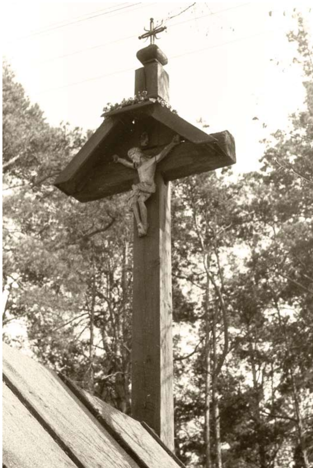
165. Korytków Duży. Krzyż z figurą Chrystusa przy kaplicy domkowej (1980)