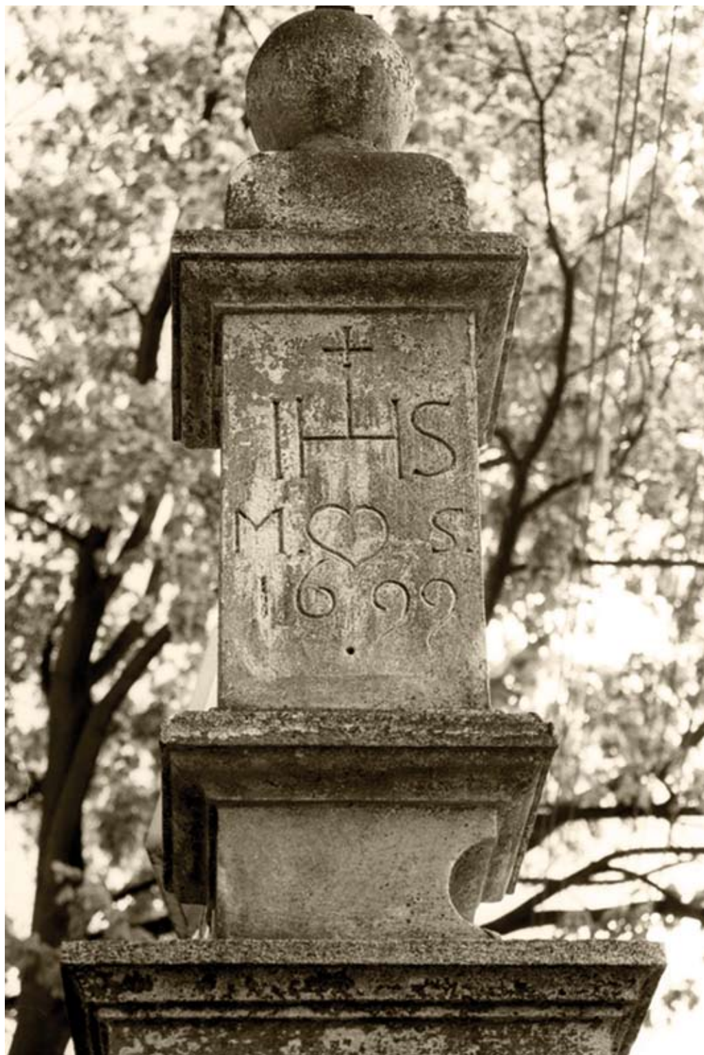
2. Biłgoraj. Fragment kapliczki z inskrypcją (2006)