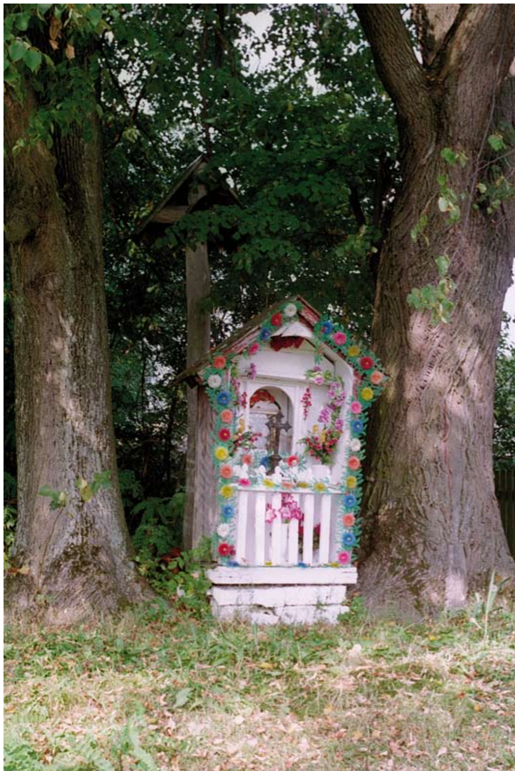
66. Aleksandrów. Kapliczka domkowa z wneką, pochodząca z 1866 roku (2006)