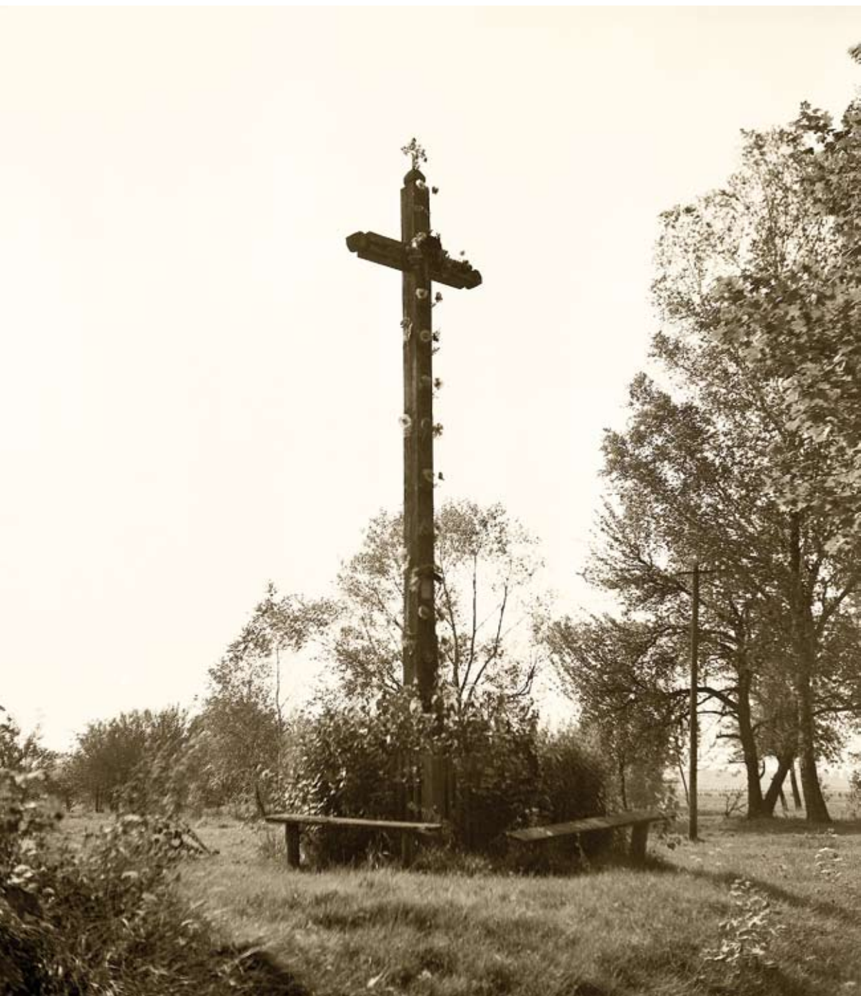
42. Smólsko Duże. Krzyż bez daszka (1980)