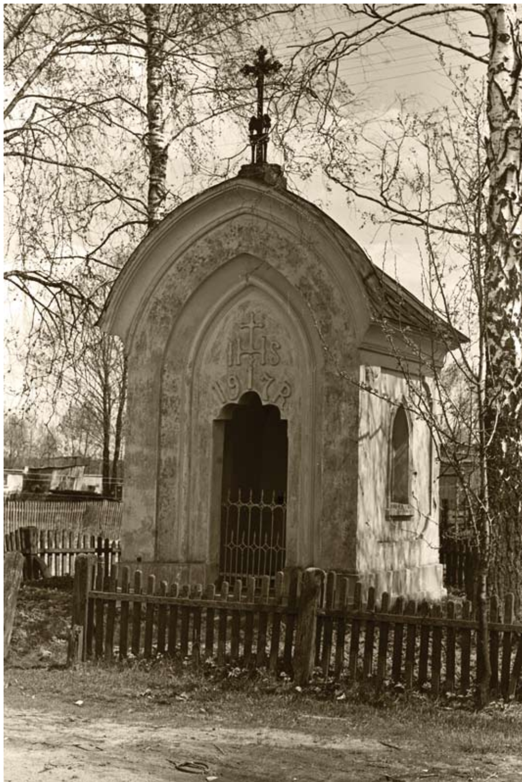
9. Biłgoraj, ul. St. Moniuszki. Murowana kapliczka domkowa z 1917 roku (1980)