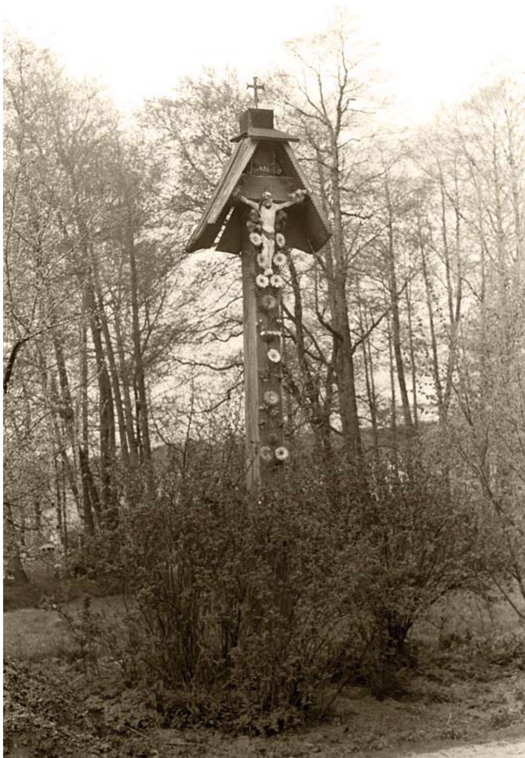
98. Dąbrowica. Krzyż z daszkiem, z rzeźbą Chrystusa (1980)