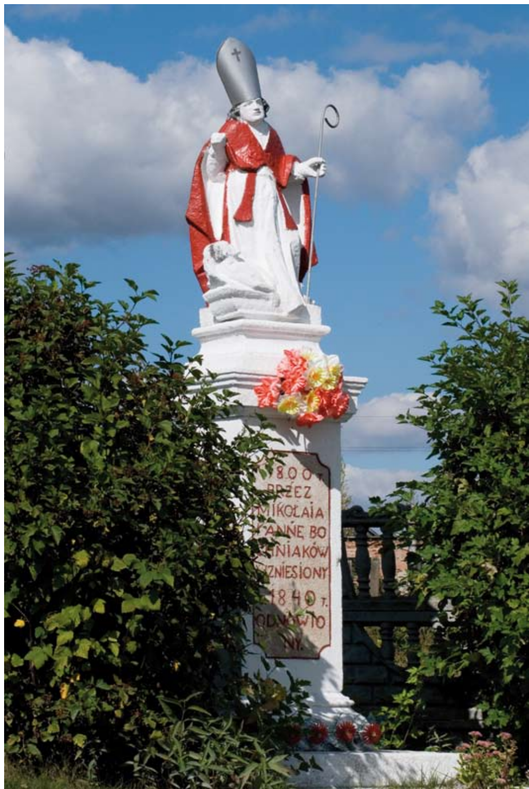
72. Aleksandrów. Kamienna figura św. Stanisława z 1800 roku (2009)