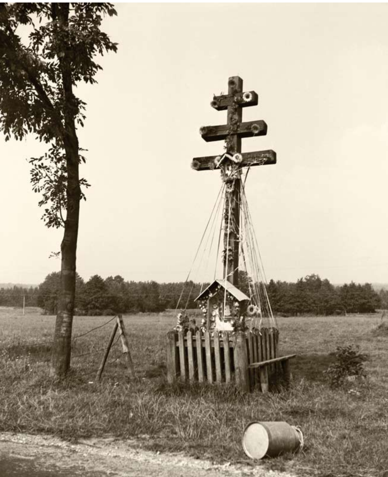
45. Księżpol. Krzyż epidemiczny (1980)