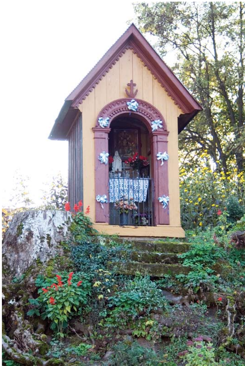
244. Goraj. Kapliczka domkowa z XIX wieku (2008)