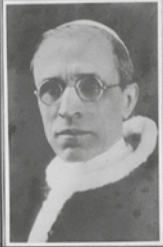
J. ŚWIĄT OJCIEC ŚWIĘTY PIUS XII