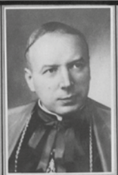
J.E. KS. KARD. STEFAN WYSZYŃSKI PRYMAS POLSKI