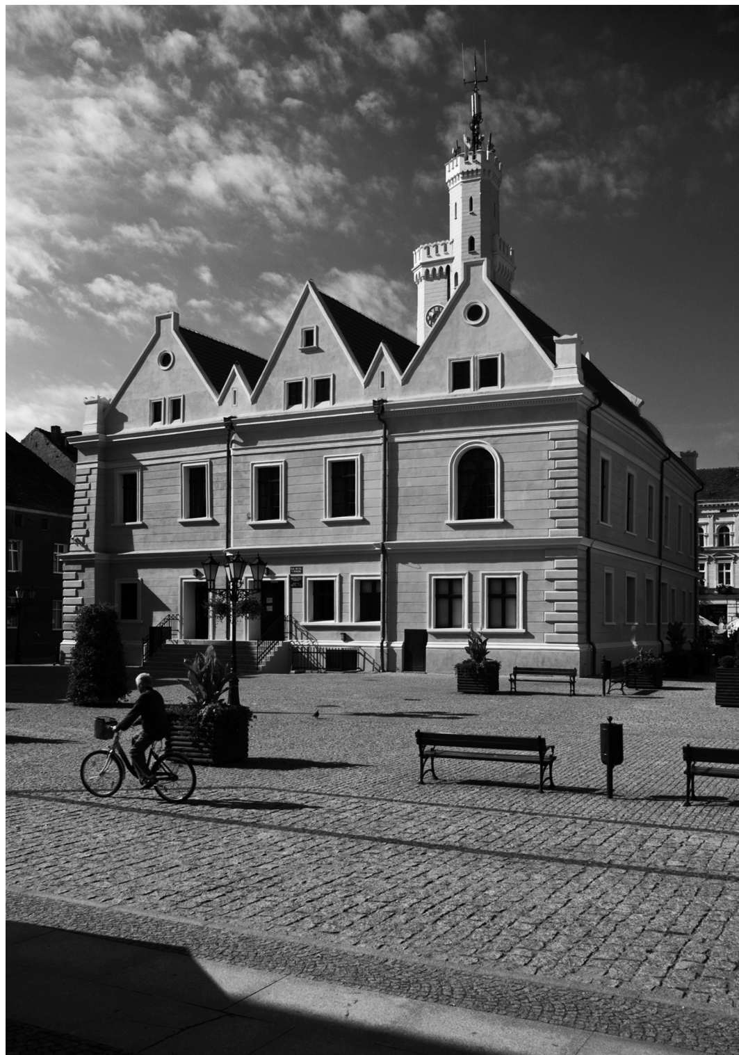
89-90. Świebodzin. Ratusz / Das Rathaus