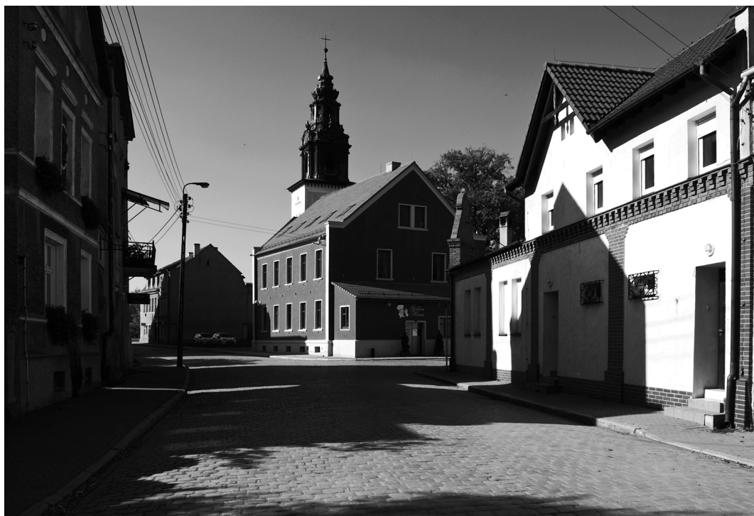
6. Krosno Odrzańskie. Fragment zabudowy miejskiej / Fragment der Stadtbebauung