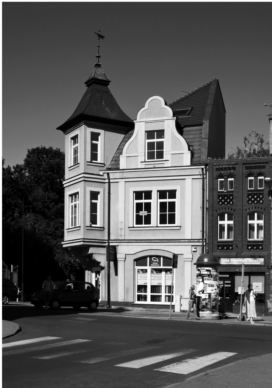
105-107. Świebodzin. Fragment zabudowy miejskiej / Fragment der Stadtbebauung (S. 110-112)