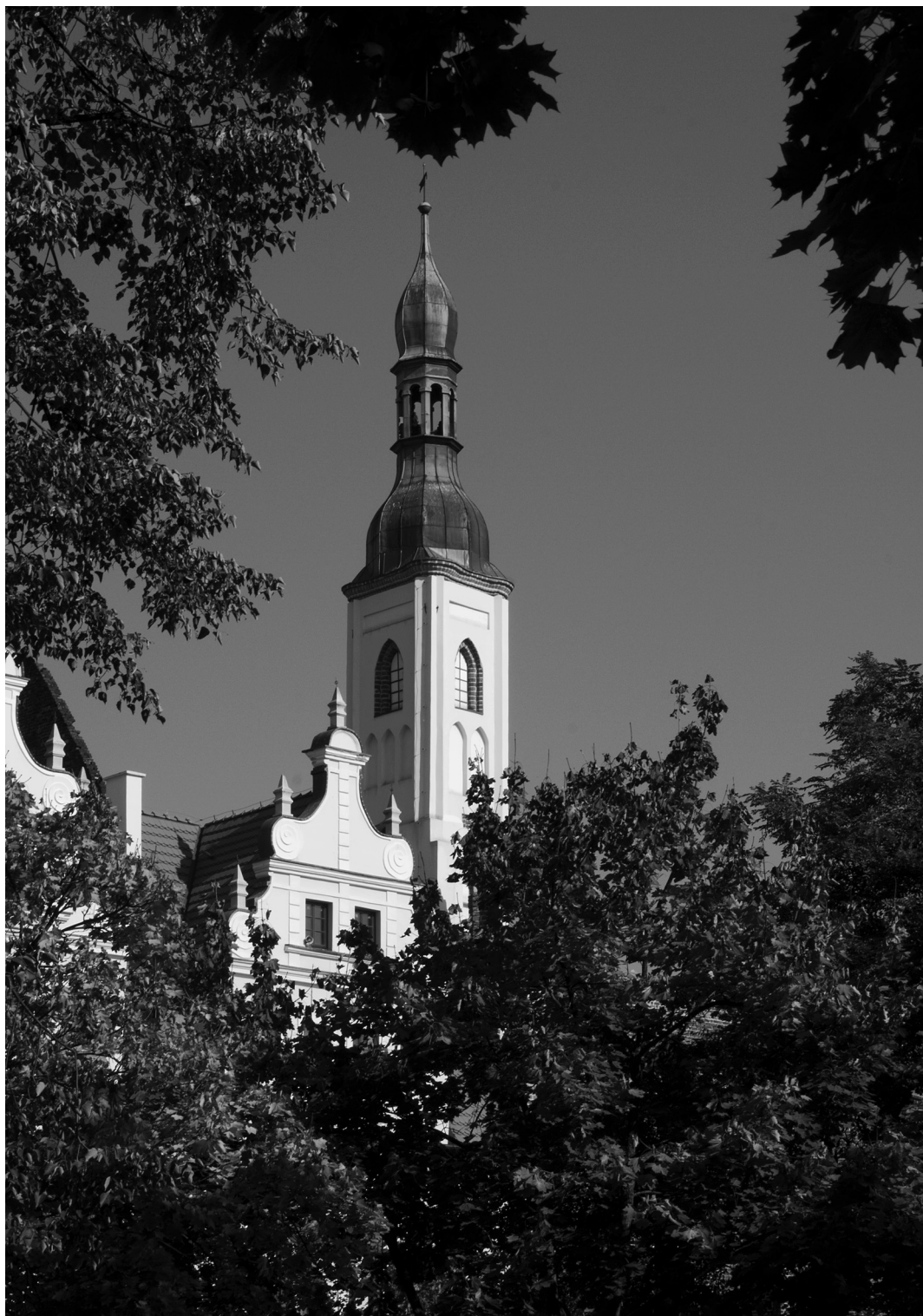
50. Gubin. Wieża ratusza / Der Turm des Rathauses

To są fragmenty tomu II książki „LUBUSKIE. Mały album dawnej architektury”. Więcej informacji na temat publikacji Agencji Wydawniczej „PDN” w Zielonej Górze można uzyskać na stronie www.agencjawydawniczapdn.pl