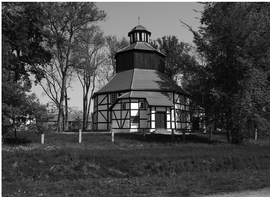
74-76. Sękowice. Kościół pw. Świętej Rodziny / Die Kirche der Heiligen Familie