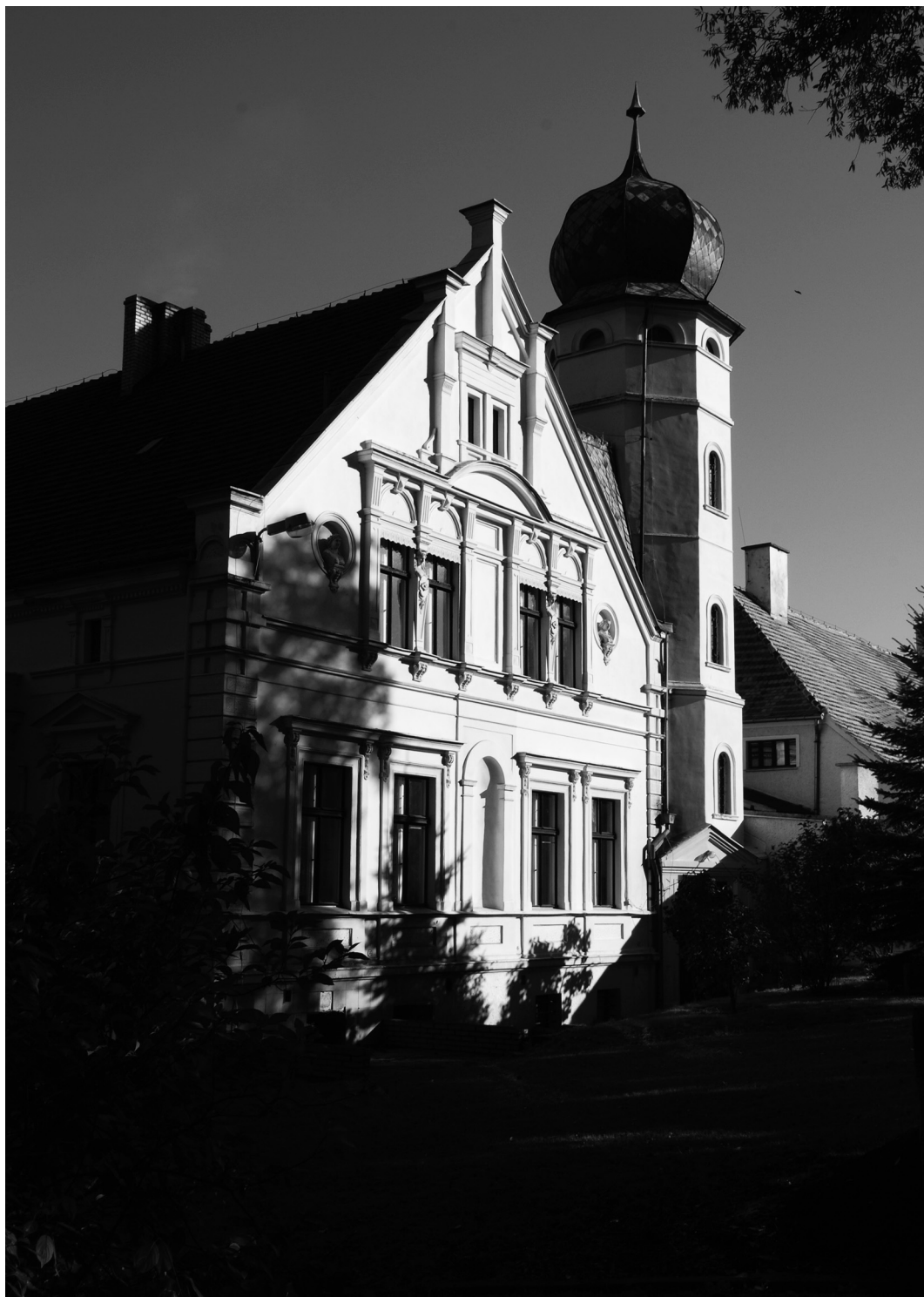
115-121. Lubinicko. Elementy zespołu rezydencjalnego: m.in. pałac i dwór Elemente des Residenzkomplexes: u.a. das Schloss und das Herrenhaus (S. 118-122)