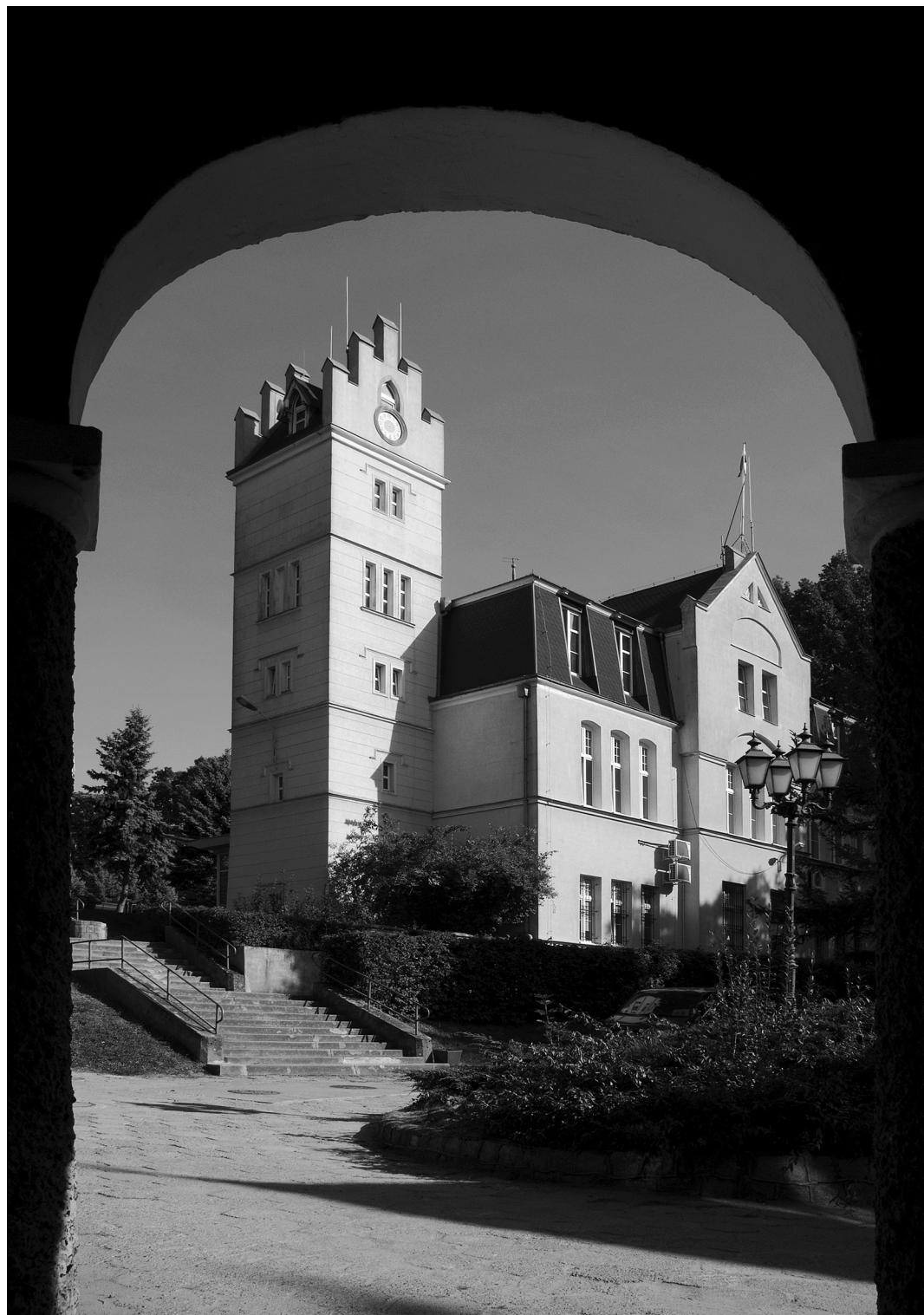
10. Krosno Odrzańskie. Siedziba Urzędu Miasta / Sitz des Stadtamtes

To są fragmenty tomu II książki „LUBUSKIE. Mały album dawnej architektury”. Więcej informacji na temat publikacji Agencji Wydawniczej „PDN” w Zielonej Górze można uzyskać na stronie www.agencjawydawniczapdn.pl