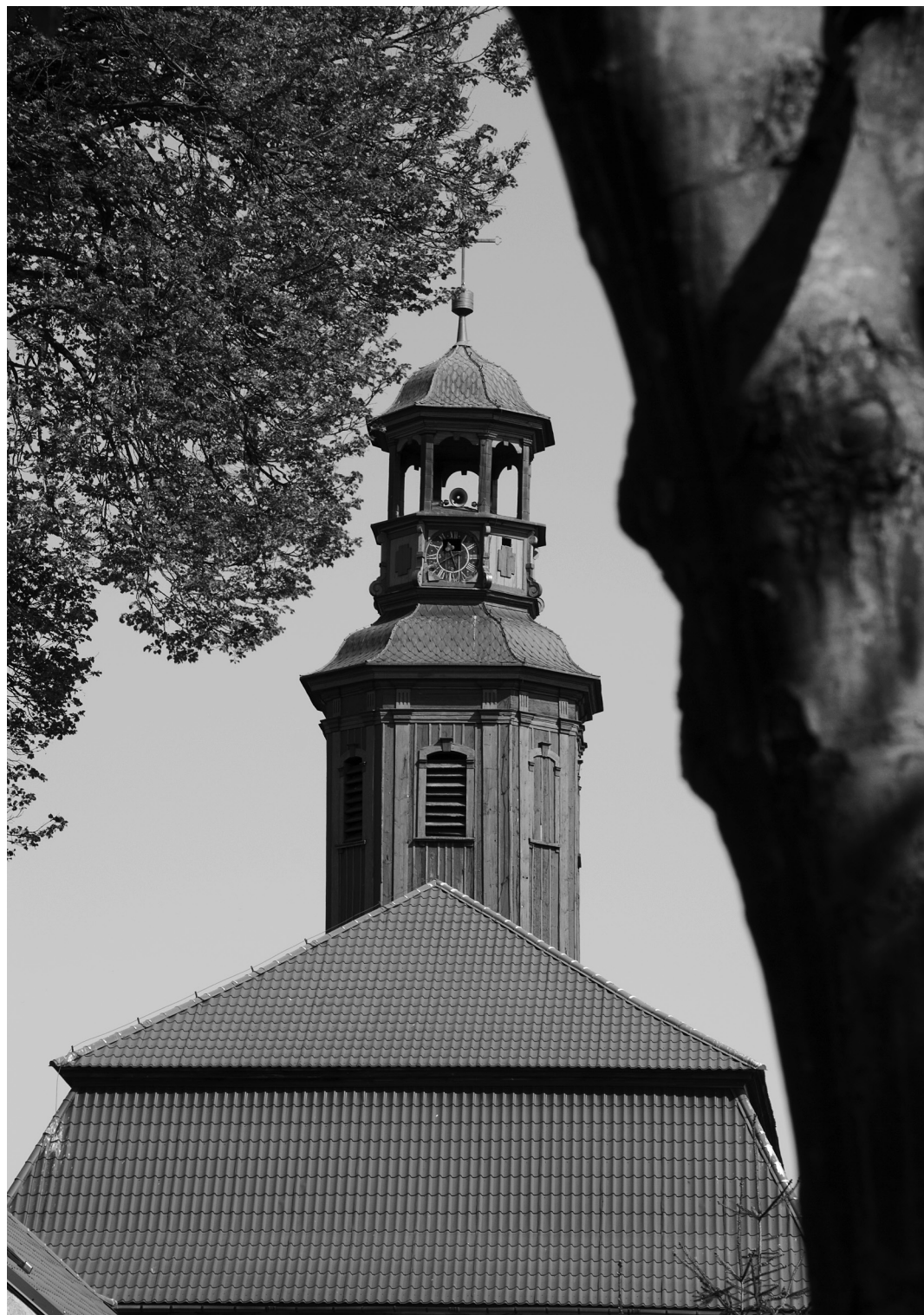
30. Bytnica. Wieża barokowego kościoła z 1750 r. / Barocker Kirchturm von 1750