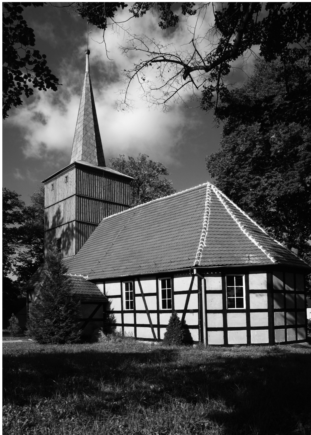
151. Żelechów. Kościół pw. św. Stanisława Biskupa Die Kirche zu hl. Stanislaus dem Bischof