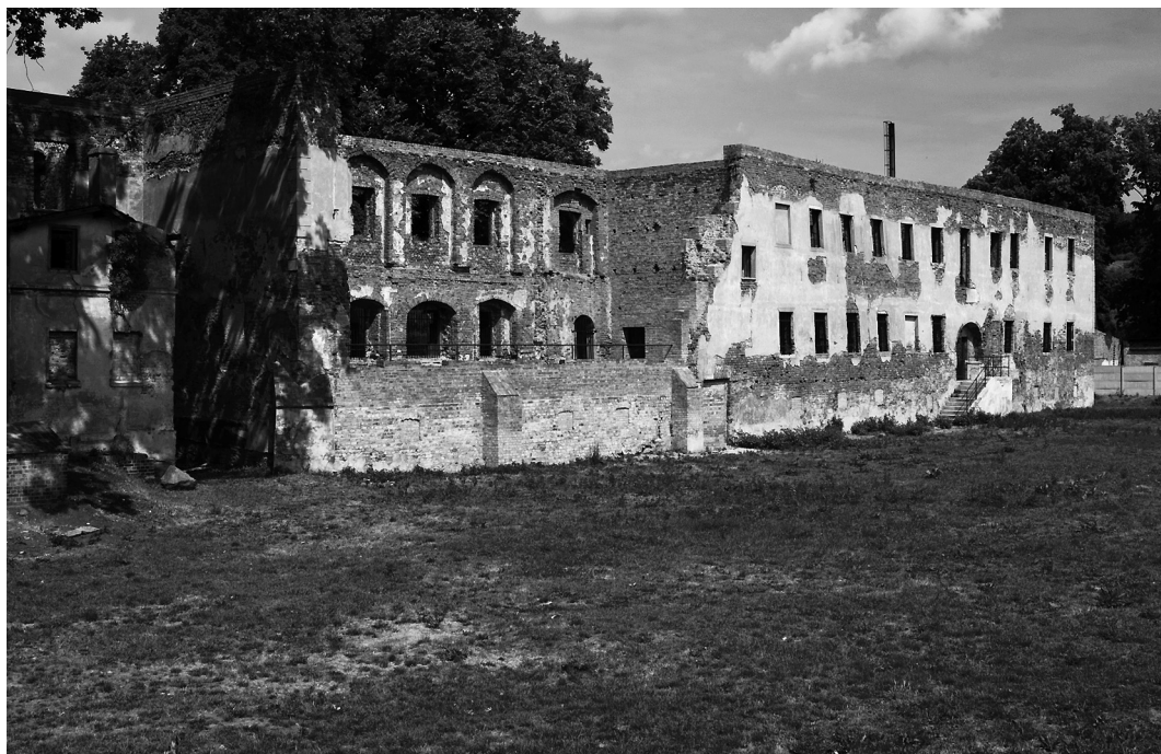
5. Krosno Odrzańskie. Fragment zamku piastowskiego w ruinie / Ruine des Piasten-Schlusses