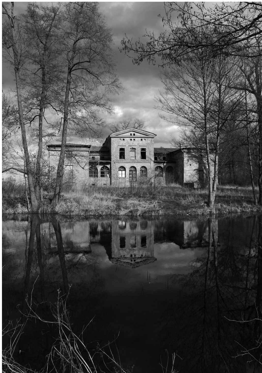
44-45. Trzebule. Neoklasycystyczny pałac / Das neuklassizistische Schloss